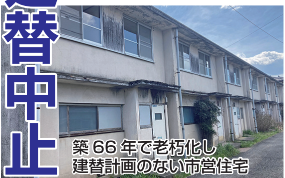
築66年で老朽化し 建替計画のない市営住宅