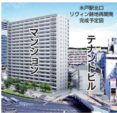
水戸駅北口 リウイン跡地再開発 完成予定図 テナントビル マンション

水戸市は、マンションとテナントビルを建設する水戸駅北口リウイン跡地の再開発に39億円も補助する方針です。事業者は長谷工とフジヤースコーポレーション、総事業費は104億円です。中庭議員は「かつて市が61億円も税金投入した水戸駅北口開発。完成したマイムビルは丸井やテナントが撤退し、現在ほぼ空きビル状態なのに、なぜまた補助するのか」と追及。