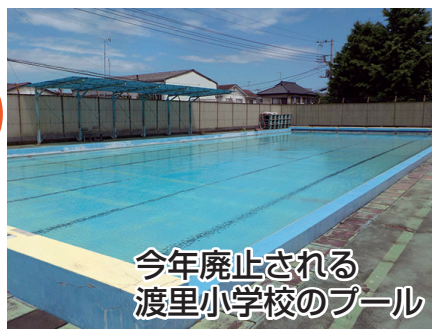
今年廃止される 渡里小学校のプール

学校プールは子どもたちの夏の楽しみであり、市民の財産です。これまでの夏休みのプール開放の努力も水の泡、毎年積み重ねてきたプー