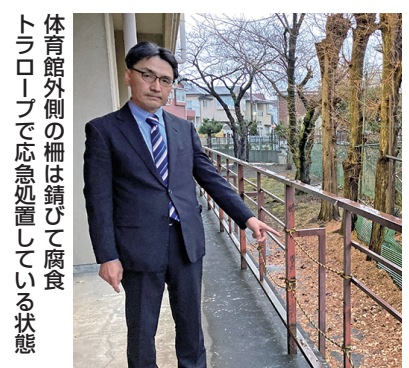
体育館外側の柵は錆びて腐食 トラロープで応急処置している状態

学校修繕予算が少なすぎます。無駄な開発に税金をつぎこむのをやめて、子ども達が快適で安全な学校で学べるよう求めてまいります。