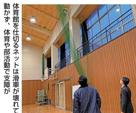
体育館を仕切るネットは滑車が壊れて動かず、体育や部活動で支障がある