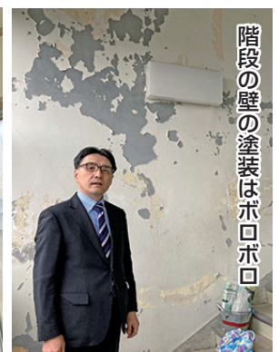
階段の壁の塗装はボロボロ