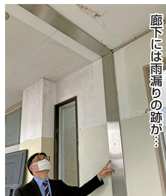
廊下には雨漏りの跡が...