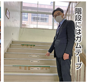
階段にはガムテープ