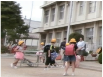
放課後の子ども達の安全な居場所づくりを

教育長は「待機児童解消や全学年受け入れのため、新たな専用棟建設や、余裕教室の転用で場所を確保する。支援員確保へ待遇改善を検討する。平成31年度までに年間を通して6年生までの受入れ実現をめざす」と答弁しました。