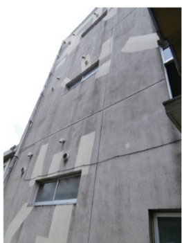
全面的な改修が待たれる石川小学校の外壁の様子