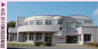
水戸市立東部図書館

6月議会に出された民間委託化の条例に日本共産党は反対しました。採決の結果、反対5、賛成22の賛成多数で可決されました。