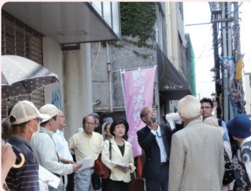
70名の市民が参加した建設予定地ウォッチング(泉町1丁目)

水戸市は新しい市民会館を、泉町・京成百貨店の向いに再開発事業で建設しようとしています。田中議員は代表質問で「施設計画が過大であり、300億円もの税金投入は認められない。位置も含め白紙に戻すべきだ」と主張しました。高橋市長は「2000席の大ホールを中心に、施設全体で3000人のコンベンションが可能な施設として、早期整備を進めると答弁しました。全国では2000席を超える大型施設の稼働率が低く、赤字を税金で穴埋めしている例が沢山あります。日本共産党は、幅広い市民の意見を聴いて計画を見直すよう求めています。」